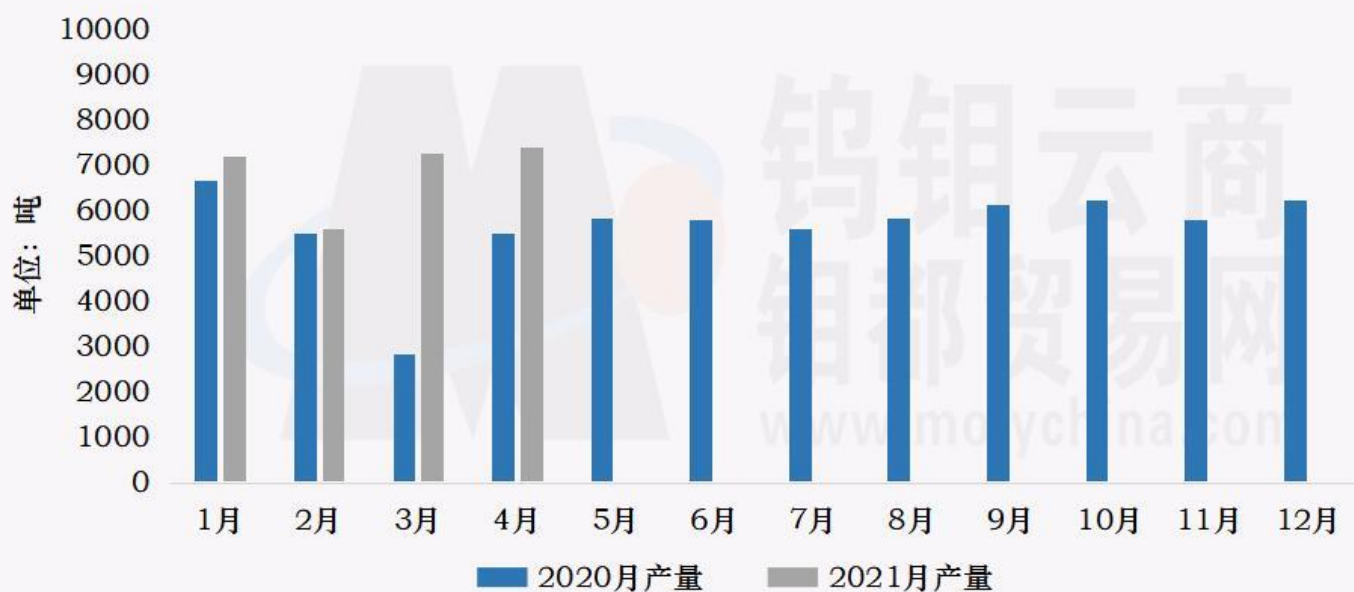
钨钼云商：2020/2021年钨粉末月度产量对比