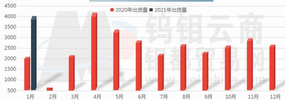
2020/2021年手机出货量变化