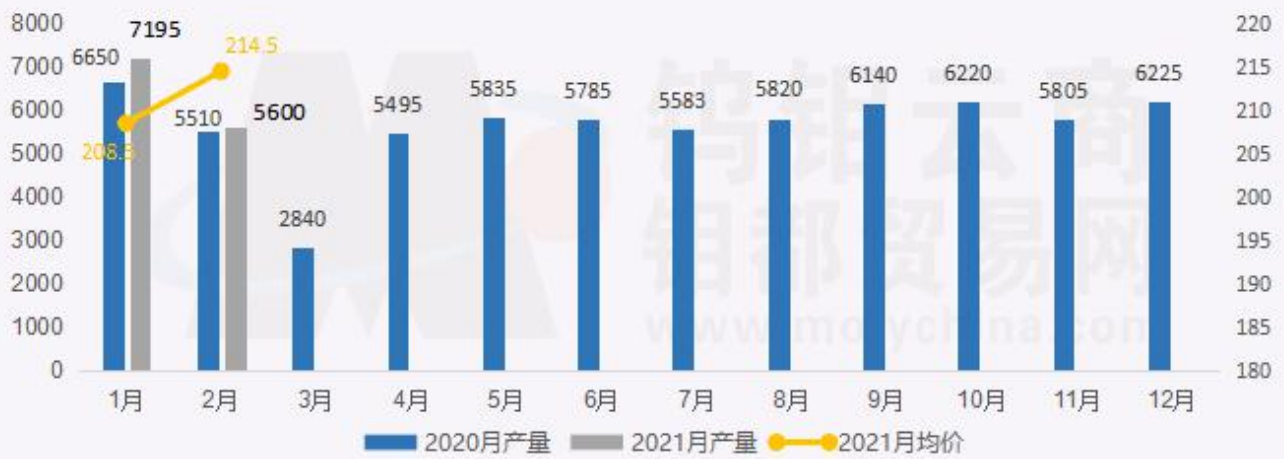
2020/2021年钨粉月产量、月均价对比